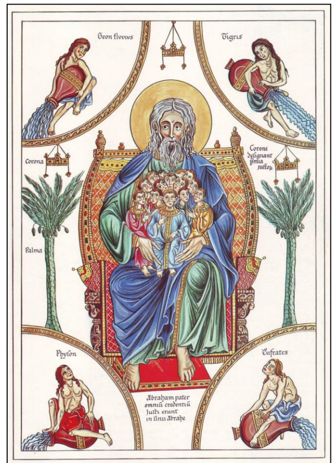
Abraham - Dnolor_01

Selten fällt es mir – und sicher auch Ihnen – so deutlich auf wie im Advent, für wen wir alles das sind – oder da sein sollten. Eine „Menge“ Menschen warten auf Post, erwarten zu Weihnachten Geschenke. Vielen begegnen wir bei Feiern und Adventsessen. Manchmal belastet es uns, dass wir für viele Menschen Zeit haben sollen und dass dabei die eigene Zeit knapp und immer weniger wird. Advent gestalten kann heißen: Ich möchte mich im Advent bemühen, „Abraham“ zu sein, Vater oder Mutter der Menge. Ich möchte mich bemühen, Menschen nicht als Last zu begreifen, sondern als Teil meiner Berufung.